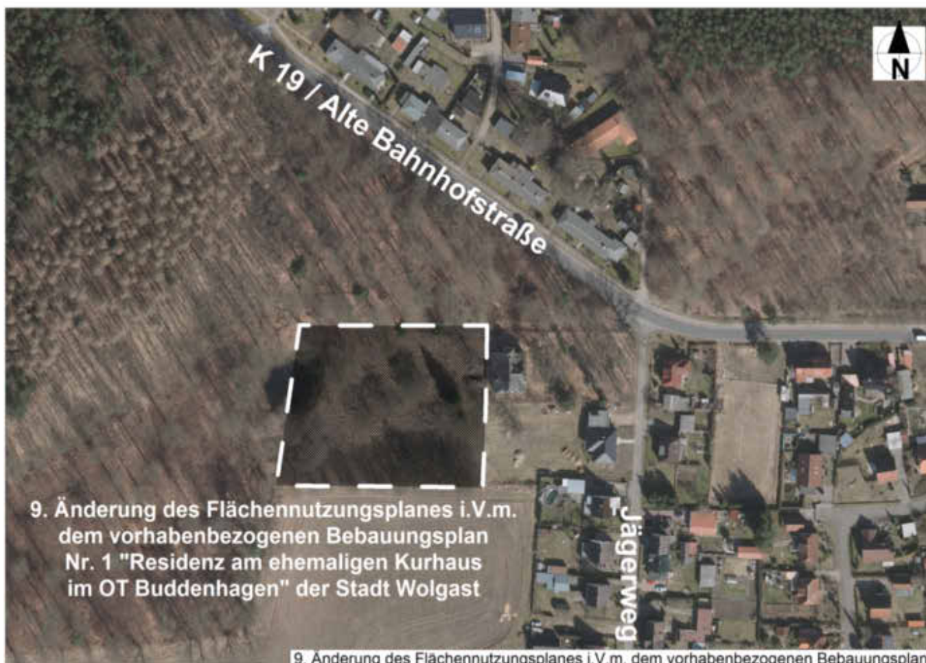
Übersichtsplan vorhabenbezogener B-Plan Nr. 1 "Residenz am ehemaligen Kurhaus im OT Buddenhagen" der Stadt Wolgast

9. Änderung des Flächennutzungsplanes i.V.m. dem vorhabenbezogenen Bebauungsplan Nr. 1 "Residenz am ehemaligen Kurhaus im OT Buddenhagen" der Stadt Wolgast