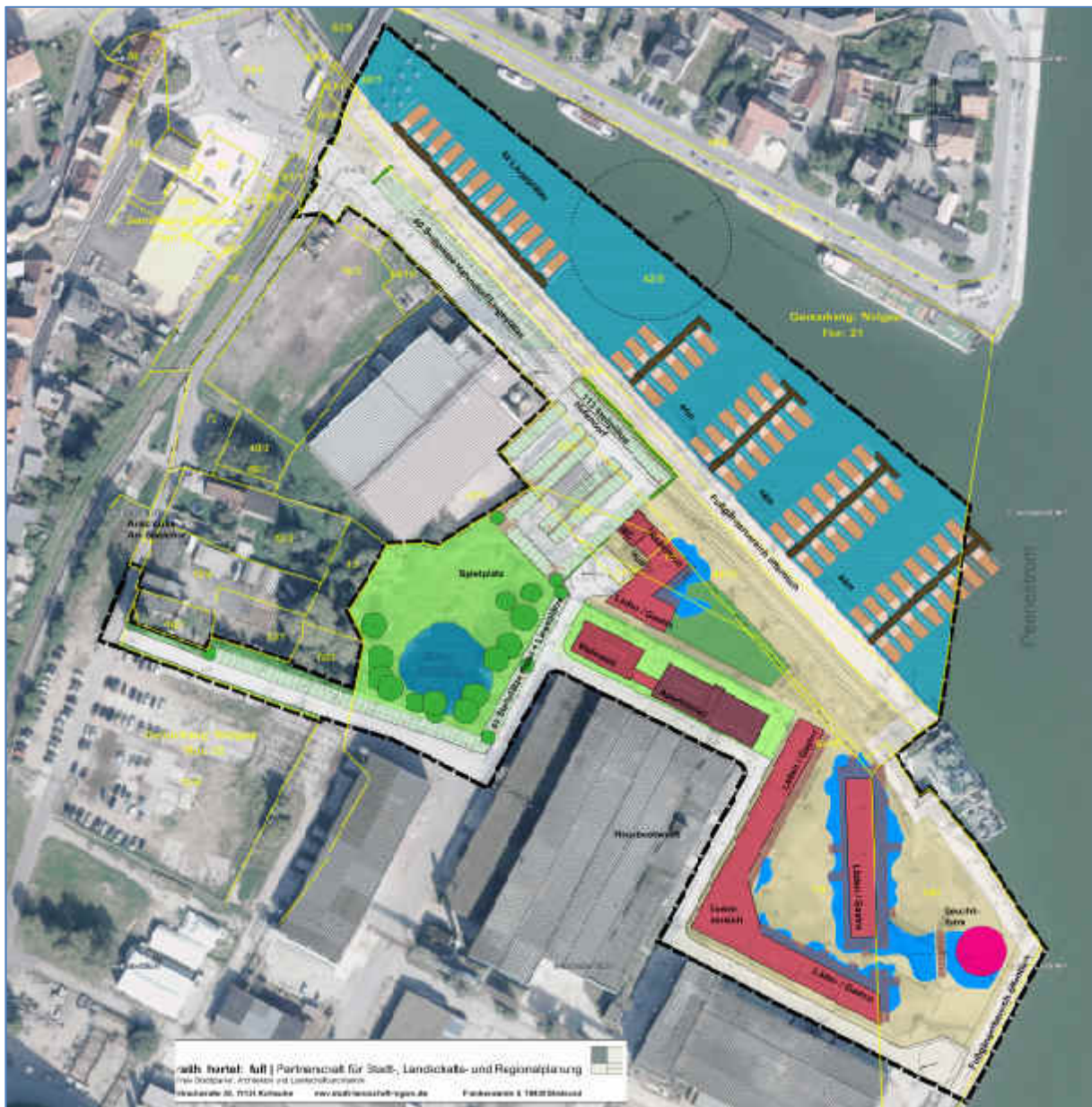
Abb. 1 Abgrenzung des Geltungsbereichs, BP 29 Entwurf 09.09.2016.