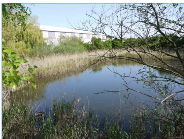
Abb. 3 Isoliertes Gewässer/ Teich im Plangebiet.

Das weitere Umfeld des Plangebiets ist geprägt durch die Altstadt von Wolgast mit ihrem historischen Stadtkern sowie der nördlich des Plangebiets liegenden Schlossinsel. Die westliche Grenze des Plangebiets bilden die in Nord-Süd-Richtung verlaufenden Gleisanlagen der Bahnstrecke Züssow-Heringsdorf/Swinemünde. Parallel zur Bahn quert die für den überregionalen Tourismusverkehr zwischen Festland und Insel Usedom bedeutende B111 die Wasserfläche zwischen Stadt- und Museumshafen.