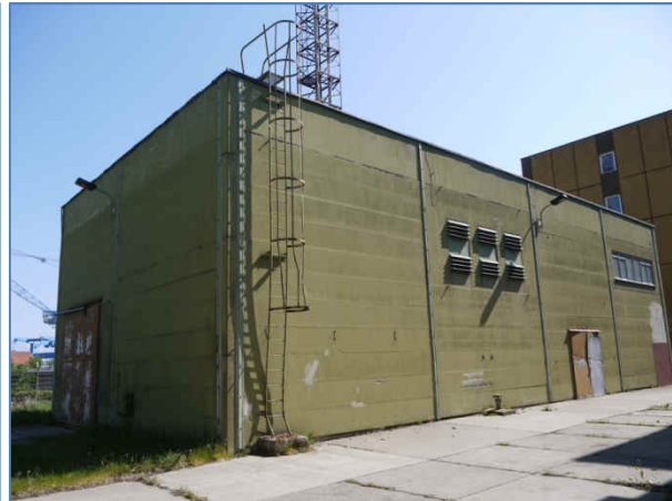
Abb. 8 Ein weiteres Gebäude der ehem. Werft.

Im Rahmen der Erstellung der Genehmigungsunterlagen sind mögliche Vorkommen sowie die Betroffenheit artenschutzrechtlich relevanter Tier- und Pflanzenarten durch das Vorhaben zu überprüfen. Die artenschutzrechtliche Prüfung stellt die Ergebnisse der Erfassungen und Betrachtungen dar und dient den Genehmigungsbehörden als Entscheidungsgrundlage.