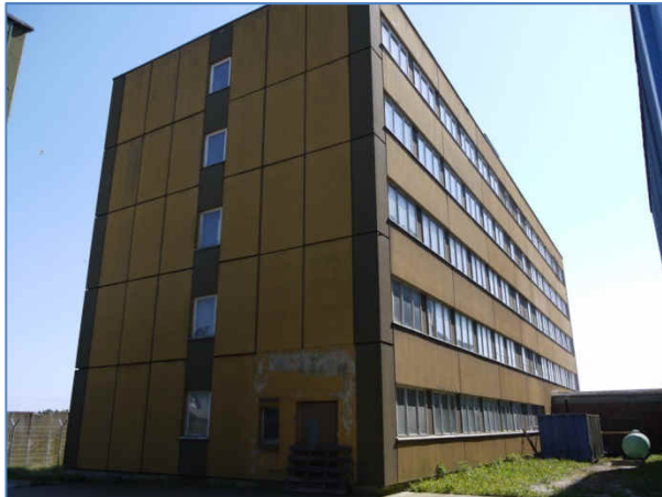
Abb. 7 Ehemaliges Verwaltungsgebäude der Werft.