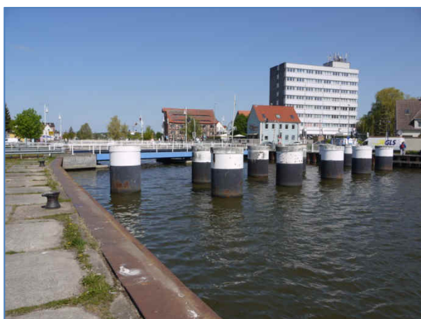
Abb. 5 Kaikante, Blick in Richtung Schlossinsel.