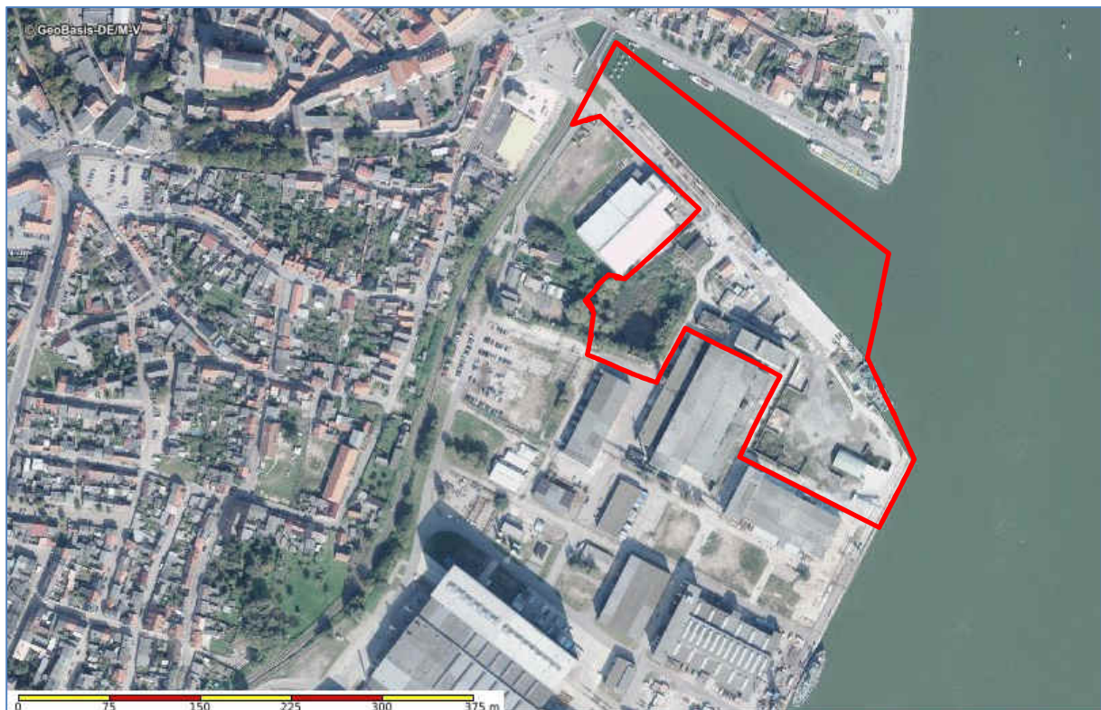
Abb. 2 Luftbild des Plan- bzw. Untersuchungsgebietes (grob umrissen) und der näheren Umgebung

Platz- bzw. Aufenthaltsflächen sowie wasserseitig eine Hausbootmarina. Ziel ist es Anziehungspunkte zu schaffen, die die Feriengäste von Usedom zu Tagesausflügen zurück nach Wolgast animieren bzw. einen eigenen, Insel unabhängigen Tourismusstamm aufzubauen. Der geplanten Nutzung liegt ein ganzheitliches Konzept unter Einbindung der angrenzenden Hausbootwerft Peenestrom GmbH zugrunde, das Produktion, Service und touristische Nutzung der Hausboote verbindet. Die am Standort Wolgast produzierten und gewarteten Hausboote werden über den Hafen verchartert.