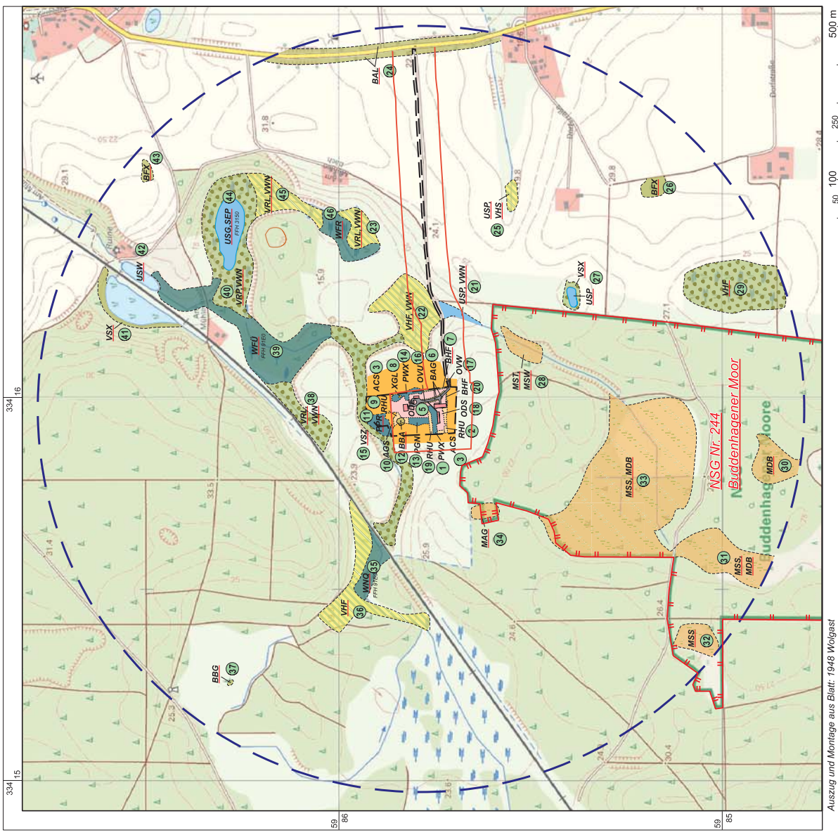
Auszug und Montage aus Blatt: 1948 Wolgast