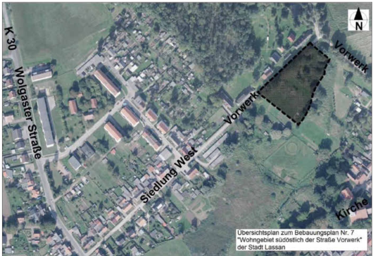
Übersichtsplan zum Bebauungsplan Nr. 7 "Wohngebiet südöstlich der Straße Vorwerk" der Stadt Lassan