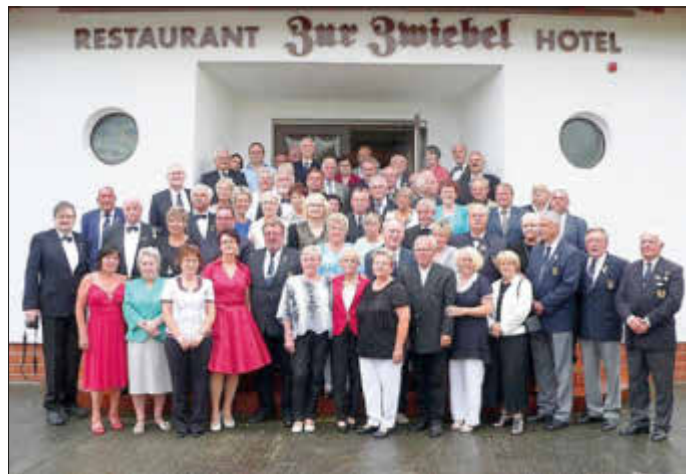
25. Jahrfeier in Peenemünde Mitglieder Schiffsmodellbaugruppe