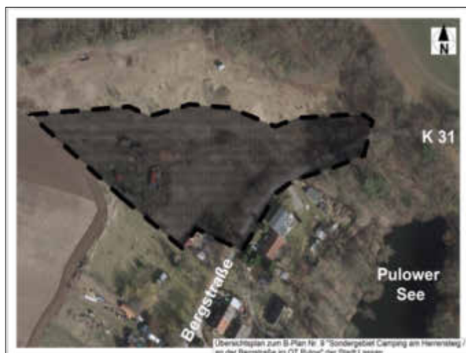
Übersichtsplan zum B-Plan Nr. 9 „Sondergebiet Camping am Herrensteig/an der Bergstraße im OT Pulow“