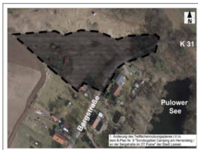
Übersichtsplan zur 1. Änderung des Teilflächennutzungsplanes (i. V. m. B-Plan Nr. 9) „Sondergebiet Camping am Herrensteig/an der Bergstraße im OT Pulow“