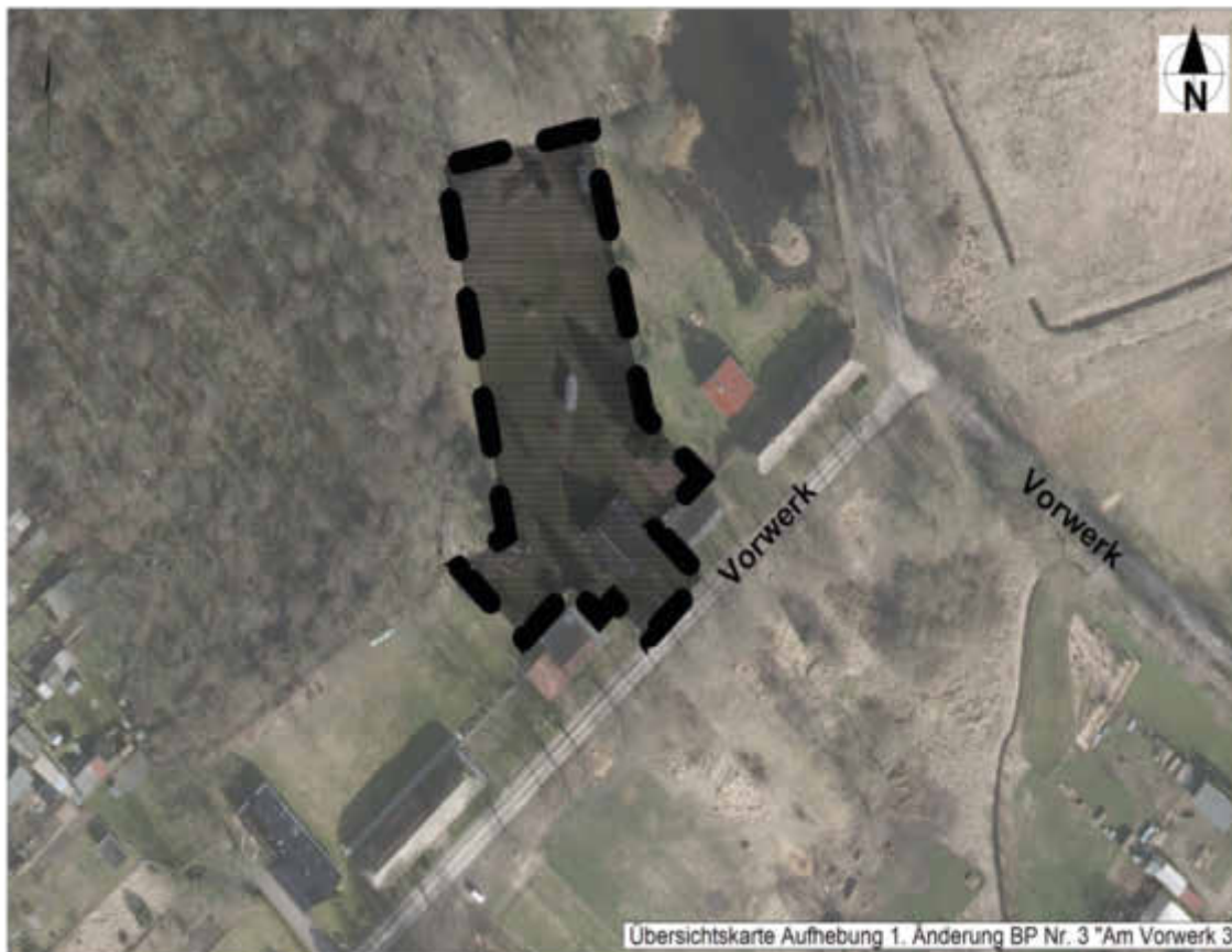
Übersichtskarte Aufhebung 1. Änderung BP Nr. 3 "Am Vorwerk 3"

Die Lage des Planbereiches ist im beigefügten Übersichtsplan dargestellt.