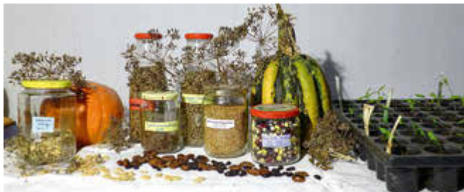
Eine Veranstaltung der Kirchengemeinde Lassan in Zusammenarbeit mit dem Duft- und Tastgarten Papendorf.

Saatgut ist die unverzichtbare Grundlage unserer Kultur. Die heimischen Sorten stellen den Reichtum einer Region dar. Auf der Börse werden Sämereien, Pflanzen und Stecklinge angeboten, getauscht oder verschenkt, bei Kuchen und Plausch. Auch ohne eigene Tauschware ist jeder willkommen.