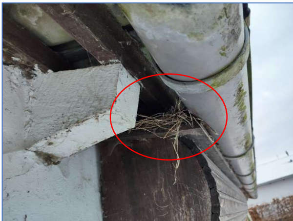
Abb. 10 Nistplatz vom Haussperling

An einem der Wohnhäuser wurde Nistmaterialie vom Haussperling ( Passer domesticus ) oberhalb der Rollladenkästen gefunden. Die Besiedlungsspuren sind bereits älter und stammen nicht aus der letzten Brutsaison 2022. Weitere Hinweise auf eine Nutzung durch gebäudebesiedelnde Vogelarten gab es nicht.