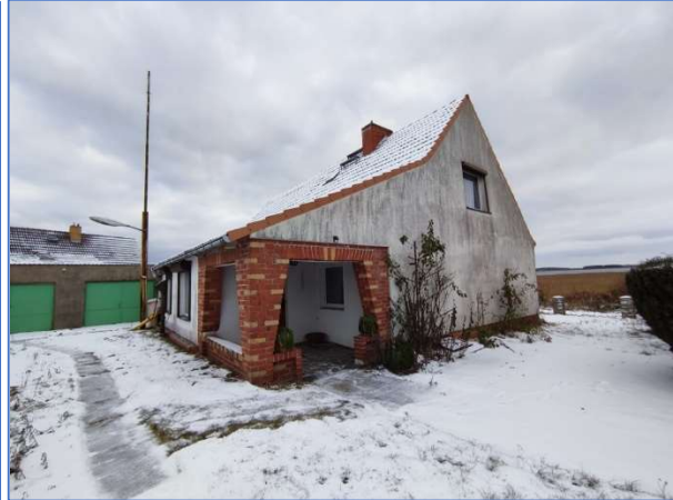
Abb. 2 und 3 Außenansichten der Wohngebäude