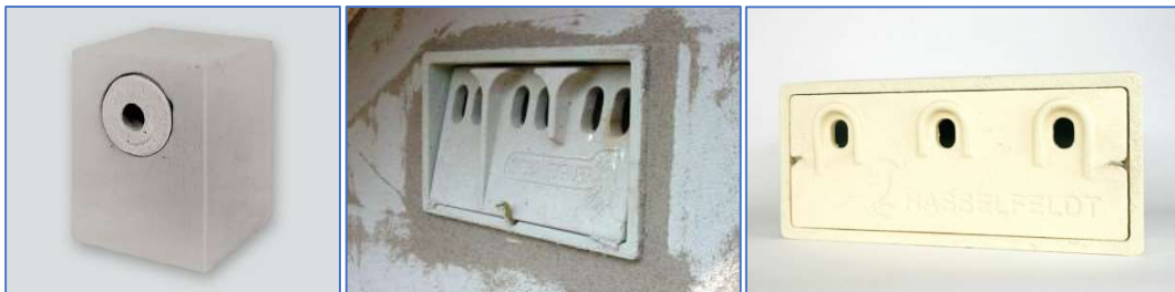
Abb. 11 bis 13 Beispiele für geeignete Ersatzlebensstätten zum Einbau in Gebäuden

Beispielsweise können spezielle Fassadenkästen oder Einbausteine integriert werden. Geeignet sind beispielsweise der Nist- und Einbaustein Typ 24 (Abb. 11) oder die Sperlingskoloniehäuser der Firma Schwegler und Hasselfeldt (Abb. 12 und 13). Eine farbliche Anpassung der Kästen bzw. ein Verputzen ist möglich.