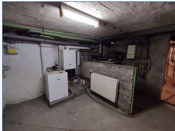
Abb. 4 und 5 Ansichten vom Dachboden und Keller