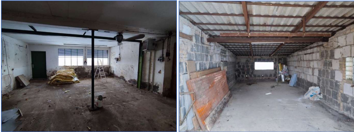
Abb. 8 und 9 Ansichten der Werkstatt und Garage