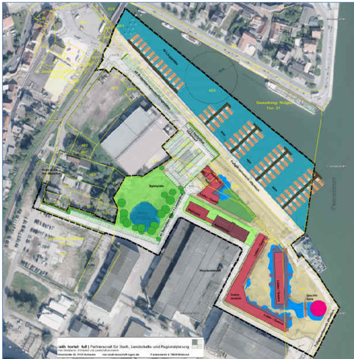
Abb. 1 Abgrenzung des Geltungsbereichs, BP 29 Entwurf 09.09.2016.