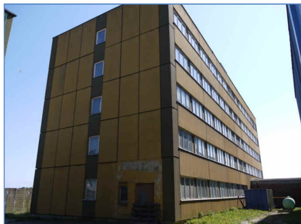
Abb. 7 Ehemaliges Verwaltungsgebäude der Werft.