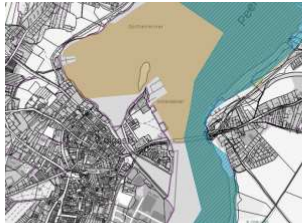
Abbildung 4: EU-Vogelschutzgebiet (braun), FFH-Gebiet (blau)

Östlich des Plangebiets befindet sich das FFH-Gebiet DE 2049-302 „Peeneunterlauf, Peenestrom, Achterwasser und Kleines Haff“. Das Schutzgebiet schließt Teile des Peenestroms sowie der unmittelbar östlich angrenzenden Uferbereiche ein. Es stellt nach Standarddatenbogen ein umfangreiches, komplex ausgestattetes Ökosystem des westlichen Oderästuars dar, das aus den Hauptbestandteilen Peenestrom, Achterwasser und Kleines Haff inklusive zahlreicher angrenzender Lebensraumtypen (Küsten- und Feuchtlebensräume) besteht.