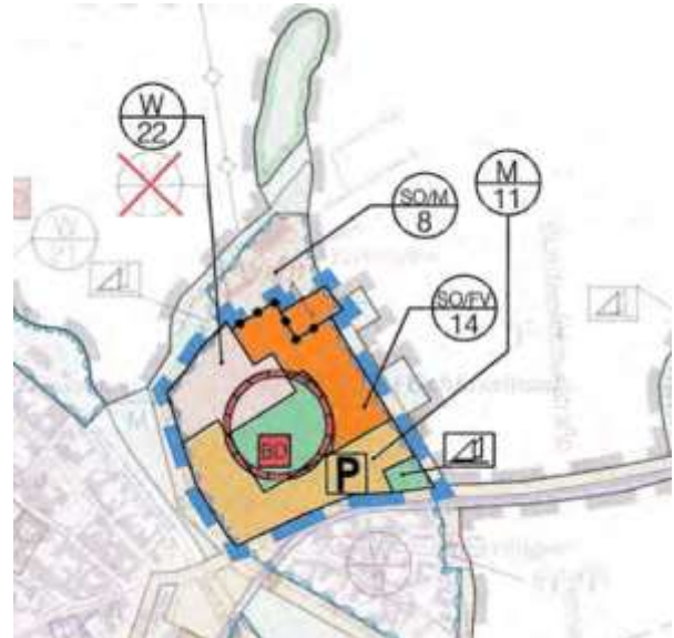
Abbildung 3: Flächennutzungsplan nach Berichtigung

Der wirksame Flächennutzungsplan (FNP) wurde auf der Grundlage des Beschlusses über die Ur- sprungsplanung nach § 13a (2) BauGB durch Ber- ichtigung an die Ausweisungen des Bebauungs- plans angepasst (vgl. Abbildung 2). Dargestellt sind gemischte Bauflächen entlang der B111 sowie sonstige Sondergebiete „Fremdenverkehr“ für Be- herbergung, Ferienwohnen, Gastronomie und ma- ritimes Dienstleistungsgewerbe. Für die nördlich angrenzende Werft wurde ein sonstiges Sonder- gebiet „Maritimes Gewerbe“ berücksichtigt. Da die Art der baulichen Nutzung beibehalten wird, ist die Änderung damit aus dem wirksamen FNP entwi- ckelt.