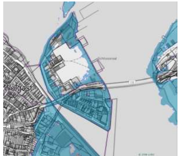
Abbildung 6: Hochwasser-Risikogebiet

Der Bebauungsplan enthält unter Ziffer 6 der Textlichen Festsetzungen die Verpflichtung, dass die Erdgeschossfußbodenhöhe von Gebäuden auf mindestens 2,35 m NHN (entspricht 2,20 m HN) liegen muss.