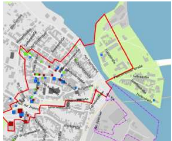
Abbildung 7: Zentraler Versorgungsbereich

Angesichts der Lage außerhalb des zentralen Versorgungsbereichs (vgl. Abbildung 7) ist eine Ausdehnung des Einzelhandels auf die nördliche Schlossinsel kritisch zu sehen. Nach den Empfehlung des Einzelhandelsgutachtens (Stadt Wolgast, Einzelhandelskonzept 09/2017) sollen Einzelhandelsbetriebe mit zentrenrelevanten Kernsortimenten (ohne nahversorgungsrelevante Kernsortimente) künftig nur noch im zentralen Versorgungsbereich Innenstadt möglich sein. Da der zentrale Versorgungsbereich in geringer Entfernung zum Plangebiet