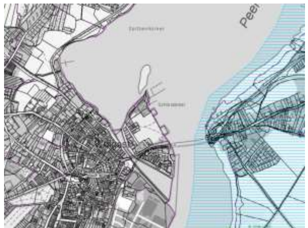
Abbildung 5: Naturpark (blau schraffiert), Quelle: Umweltkarten MV

Östlich des Plangebiets verläuft die westliche Grenze des Naturparks NP 5 „Insel Usedom“. Zweck des Naturparks "Insel Usedom" ist die einheitliche Entwicklung eines Gebietes, das wegen seiner landschaftlichen Eigenart, Vielfalt und Schönheit eine besondere Eignung für die landschaftsgebundene Erholung und den Fremdenverkehr besitzt. Diese Zielsetzung umfasst gleichran-