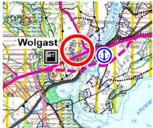
Abbildung 2: RREP, o. M.

Die Tourismusentwicklungsräume sollen nach 3.1.3(6) unter Nutzung ihrer spezifischen Potenziale als Ergänzungsräume für die Tourismusschwerpunkträume entwickelt werden. Der Ausbau von weiteren Beherbergungseinrichtungen soll möglichst an die Schaffung bzw. das Vorhandensein touristischer Infrastrukturangebote oder vermarktungsfähiger Attraktionen und Sehenswürdigkeiten